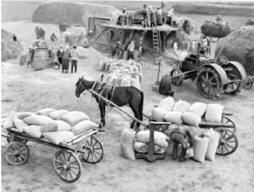
схожая с нашей технология Technologie ähnlich wie bei uns

Der letzte Arbeitstag war bis zum Mittag. Alle kamen um uns zu verabschieden. Kolchosbauern, Dorfjungen, die sich mit uns angefreundet haben. Der Kolchosvorsitzende dankte uns für die gute Arbeit und das gute Benehmen und wünschte uns ein gutes Studium.