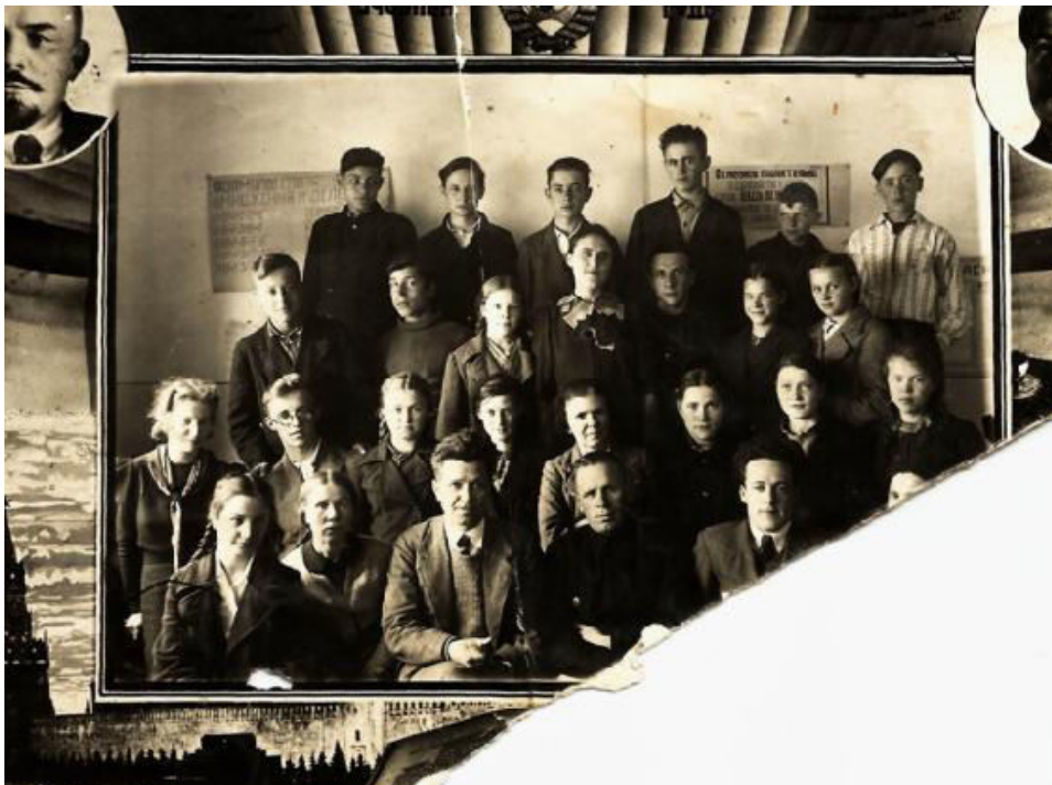
НАШ ШКОЛЬНЫЙ КЛАСС unsere Schulklasse